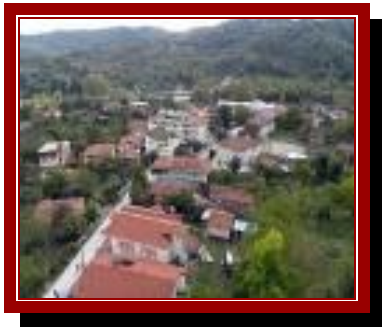
Sapanca Akçay Mahallesi

Okulumuz Sapanca merkeze 7 km ve Sakarya İl Merkezine 17 km uzaklıktadır.