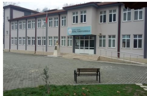
Kemal Yener İlk-Ortaokulu